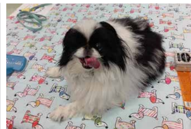
Naša »tačka pomagačka«

V Dnevu za spremembe, meseca aprila, se nas je zelo dotaknila akcija Zavarovalne skupine Sava, ki nam je podarila cvetlice v lončnicah, da z njimi obogatimo izgled bivanjskih prostorov naših stanovalcev.