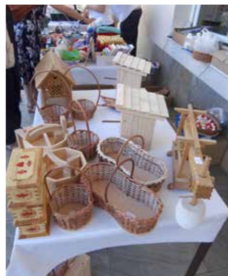
Izdelki izpod spretnih rok