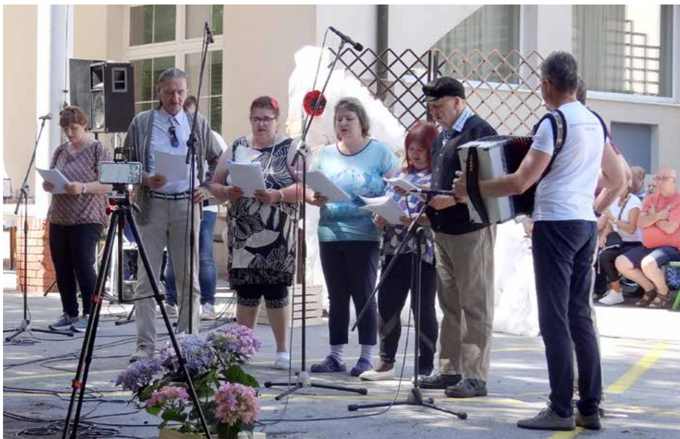
Pevska skupina Zarja

jo poseben odnos vseh, ki s temi ljudmi delajo. Sem glasbenik in čeprav nisem usposobljen kot terapevt, pri svojem delu s stanovalci uporabljam glasbo (harmoniko, petje), s katero vplivam na doživljanje uporabnika. Glasba ima čudežno moč in mi omogoča, da z vključenimi vzpostavljam odnos zaupanja in varnosti. Glasbeno znanje mi daje možnost, da vstopam v njihov svet notranjega doživljanja in izražanja čustev ter možnost za individualno delo, saj spodbuja, da na površino pride tisto, kar se ne da povedati z besedami, in je morda največje bistvo vsakega človeka.