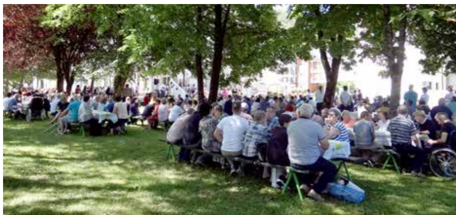
Skupaj v zavetju domskega parka