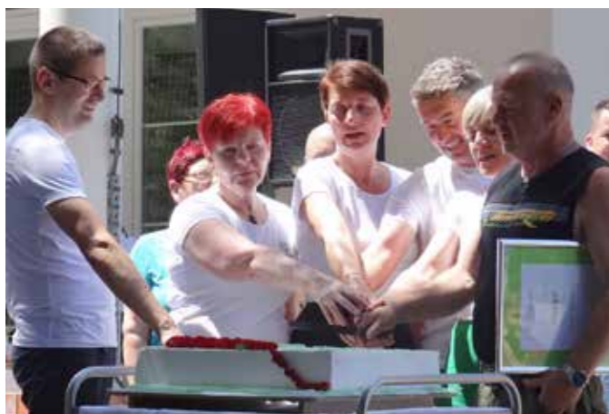
Proslavimo s praznično torto