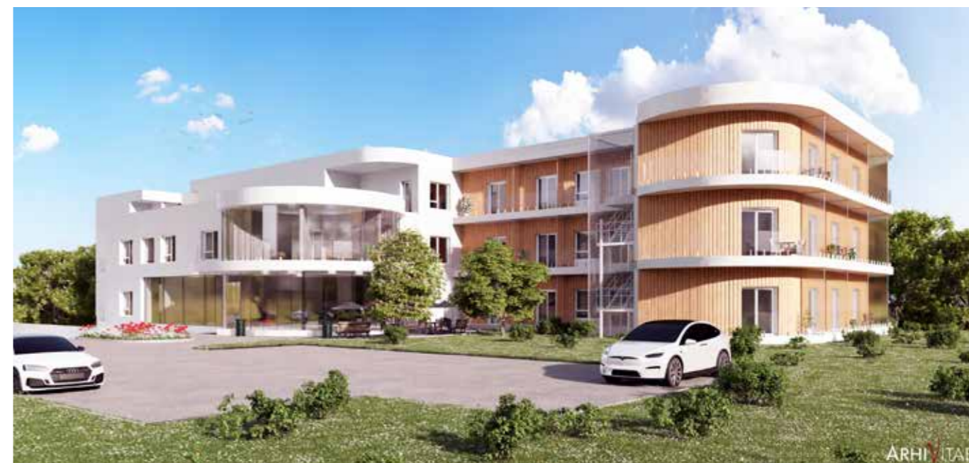
Novi dom se bo nahajal na Hrastih v občini Sevnica.