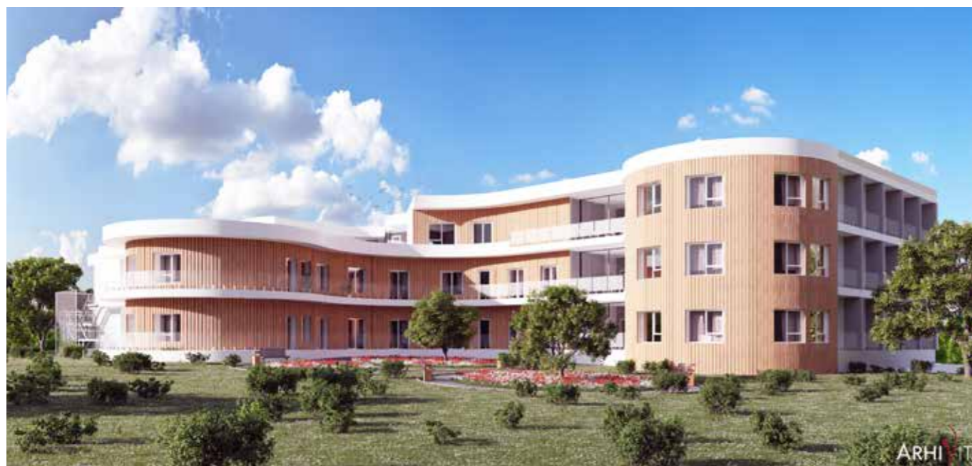
Naš novi dom v Sevnici čez nekaj let