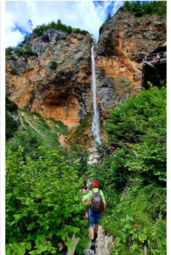
»Tavžentroža« na pohodu

Funkcionalno umeščena terasa nam nudi stik