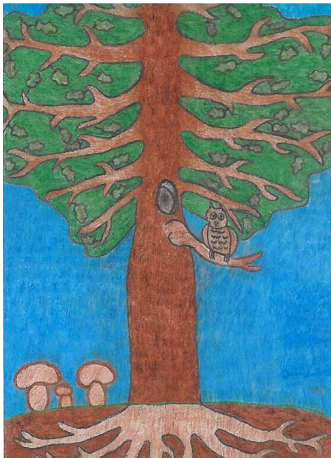
Avtorsko delo: Primož Pucelj, stanovalec