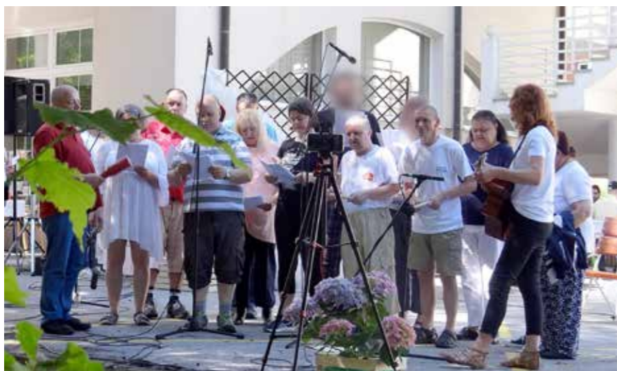
Zborček iz bivalnih enot