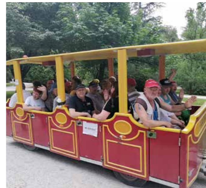
Z vlakcem skozi čudovito naravo

Zaradi slabe finančne slike v turizmu, ki je nastala zaradi koronakrize, je Slovenija vsem državljanom za leto 2020 in 2021 podarila turistične bone. Bone za leto 2020 smo lahko uporabili za nastanitev z zajtrkom. Polnoletna oseba je dobila