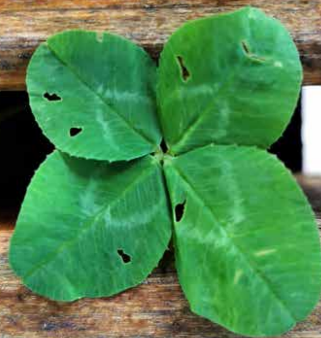
Avtorska fotografija: štiriperesna deteljica Ivi Plaskan, stanovalec

Ko prihajam na obisk k bratu, imam občutke, da je za stanovalce doma dobro poskrbljeno; ču-