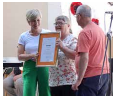
Podelitev zahval in priznanj stanovalcem