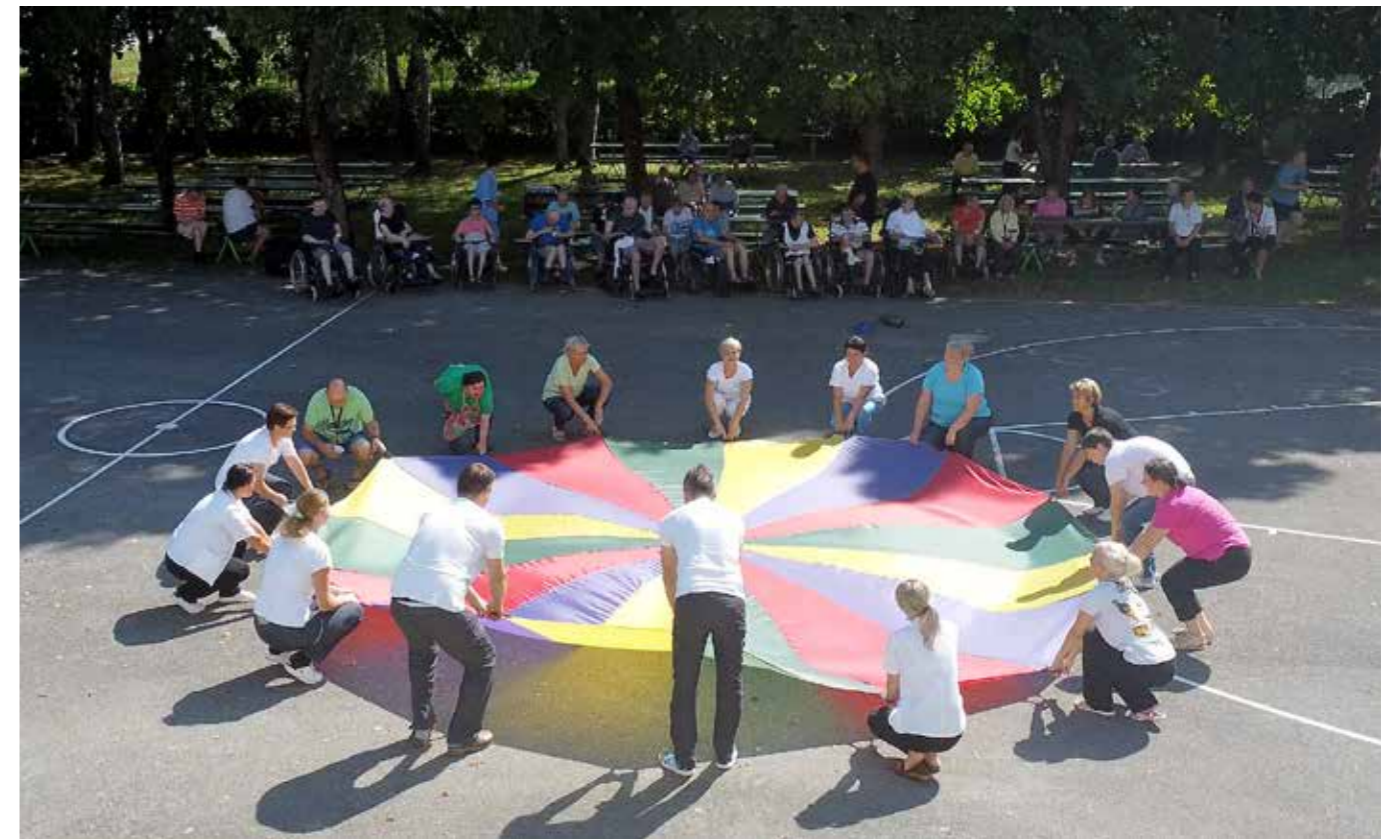
Sladoledni piknik v domskem parku, julij 2022