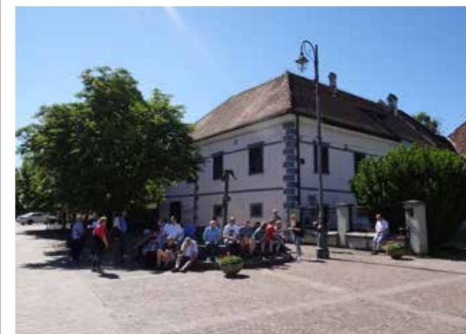
Na izletu v Kostanjevici na Krki