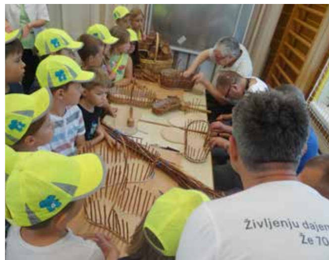
Otroci se učijo veščine pletenja košaric

Dogodek je potekal na ploščadi pred Kulturnim domom Krško. Prejeli smo dve nagradi za likovni in fotografski prispevek.