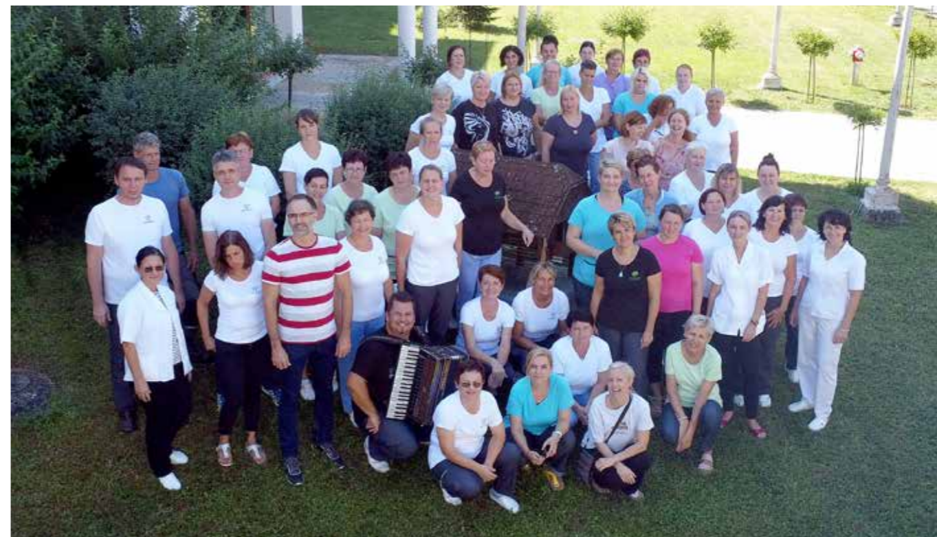
Po sladolednem pikniku v domskem parku, julij 2022