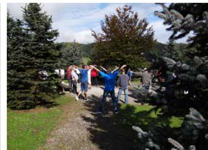
Radi telovadimo v našem parku