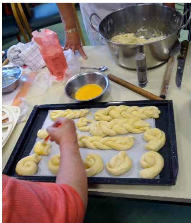
Dobrote izpod rok Aktiva kmečkih žena

UDELEŽBA NA 40. FESTIVALU IDRISKE ČIPKE , kjer smo se na »Sejmu domače in umetnostne obrti ter klekljarskih pripomočkov« predstavili z ustvarjalnimi izdelki naših stanovalcev (lesni in mešani program), ki nastajajo v zaposlitvenih in terapevtskih skupinah že vrsto let. Največ navdušenja in pozornosti je pritegnil KOZOLEC TOPLAR, za katerega smo v DUO Impoljca prejeli naziv kolektivne blagovne znamke SEVNICA PREMIUM, na kar smo še posebej ponosni. Lastnik KBZ Sevnica