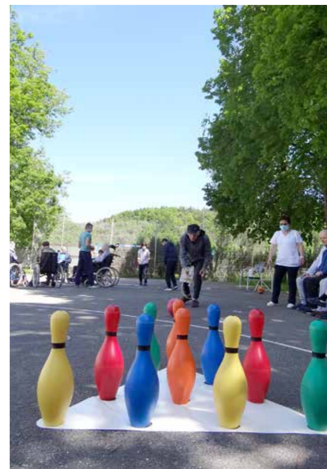
Veselo na našem igrišču