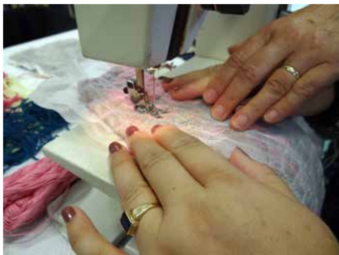
Izdelava zračne čipke

UDELEŽBA NA 40. FESTIVALU IDRISKE ČIPKE , kjer smo se na »Sejmu domače in umetnostne obrti ter klekljarskih pripomočkov« predstavili z ustvarjalnimi izdelki naših stanovalcev (lesni in mešani program), ki nastajajo v zaposlitvenih in terapevtskih skupinah že vrsto let. Največ navdušenja in pozornosti je pritegnil KOZOLEC TOPLAR, za katerega smo v DUO Impoljca prejeli naziv kolektivne blagovne znamke SEVNICA PREMIUM, na kar smo še posebej ponosni. Lastnik KBZ Sevnica