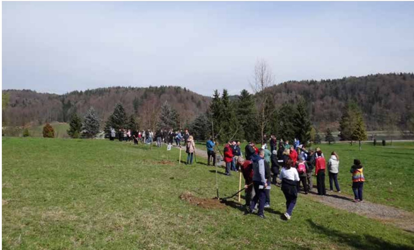
Sajenje dreves v parku

ke. Zasnovan je bil kot čutna pot in takšnega želimo ohranjati tudi v prihodnje.