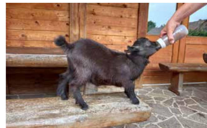
Majhen kozliček je pil mleko na dudo.