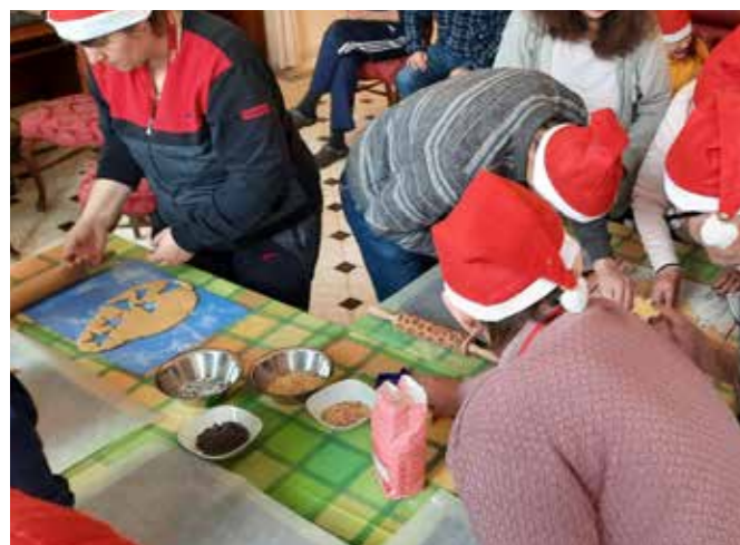
Praznično vzdušje ob peki piškotov