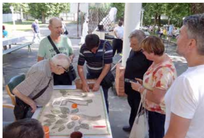
Izdelovanje mozaika skupaj z obiskovalci