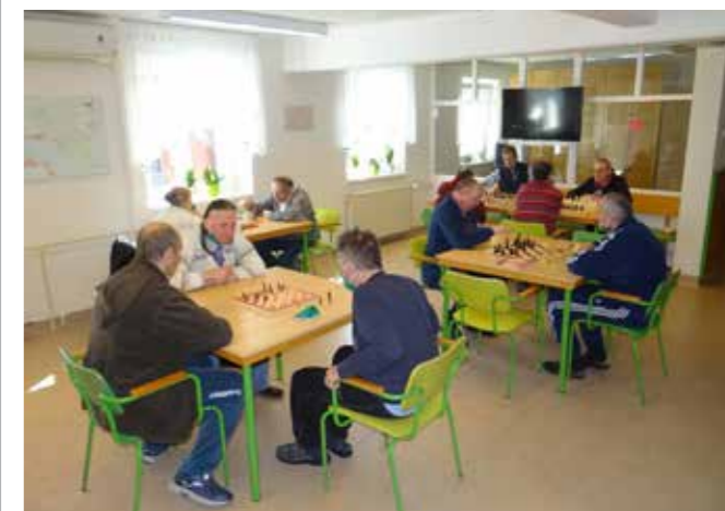
Šahovski turnir v našem Domu