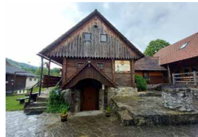
Videli smo čez 250 let staro hišo.