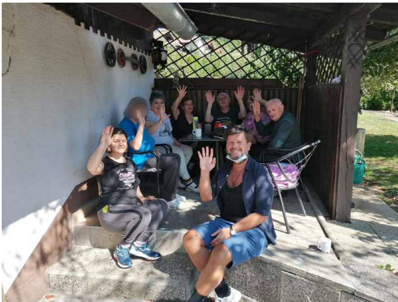
Pozdrav za lepši dan

omrežjih, spletnih nakupih ... In to z domačega naslonjača, ali od koder koli z napravico v dlani. Čas epidemije pa nam je omogočil tudi skoraj dovršeni sistem dostave na dom. Pozabimo na zapravljanje, pozabimo na pričakovanje, pozabimo na materialni svet. Kultura in umetnost naredi človeka - človeka. In preplet napredka je knjižnica na dom. Hvala, naprednemu duhu medobčinske skupnosti. Potujoča knjižnica je veselje, ki prispeva na naše dvorišče. Dobrodošli, vstopite.