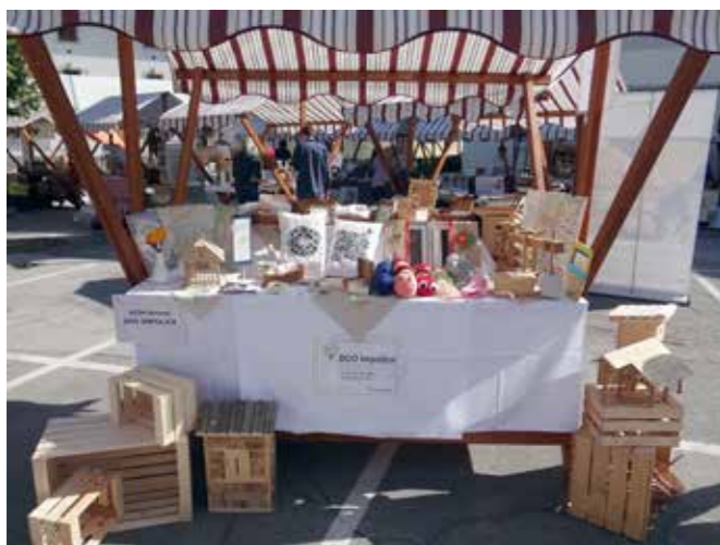
Predstavitev izdelkov DUO Impoljca v Idriji