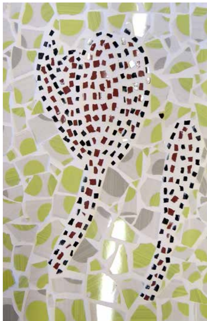
Avtorsko delo: Albin Kozamernik