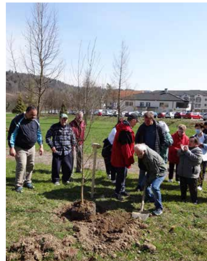
Stanovalci posadijo lipo

V domskem parku smo simbolično posadili drevesa, da bi tako počastili življenje in z optimizmom zrlili v prihodnje dni. Naš park je pomemben prostor druženja, preživljanja prostega časa, rekreacije in sprostitve. Pred trinajstimi leti smo ga zasadili s pomočjo donacije svojca naše stanoval-