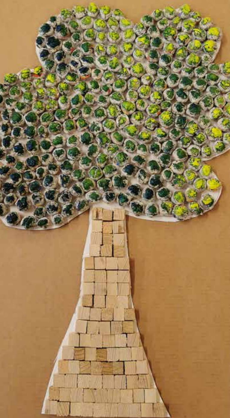
Izdelek skupine delovne terapije