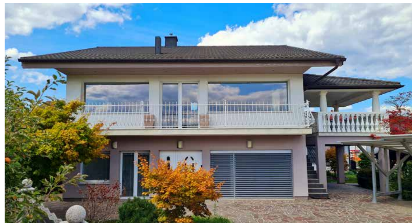
Nova bivalna enota v Brežicah

Tako je npr. zelo pomembno, kako naslavljamo svoje stanovalce. Včasih so bili varovanci, oskrbovanci, kar je odraz takratnega časa, pogleda in strokovnih pristopov. Danes so, ali uporabniki storitev ali stanovalci, saj je njihova vloga aktivna, imajo možnost vplivati na življenje, soustvarjajo življenje. Poimenovanje je pomemben element izražanja spoštovanja do človeka.